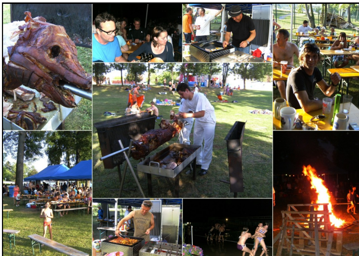
Alle Fotos sind auf www.sc-badsauerbrunn.at unter der Rubrik "Fotos" zu betrachten

Piribauer Metall und Glas - Structure Solutions