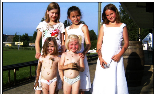
Etwas andere 'Fans': Von der Erstkommunion direkt auf den Sportplatz